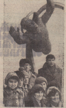
ПОБЫВАЛИ В МОСКВЕ

Я провёл свою первую разведку в 16 лет. Сегодня можно назвать сотни имён 13-летних разведчиков недр Родины. От всей души хочу пожелать: ранних вам стартов в работе, ребята, ранней гордости за результат труда!